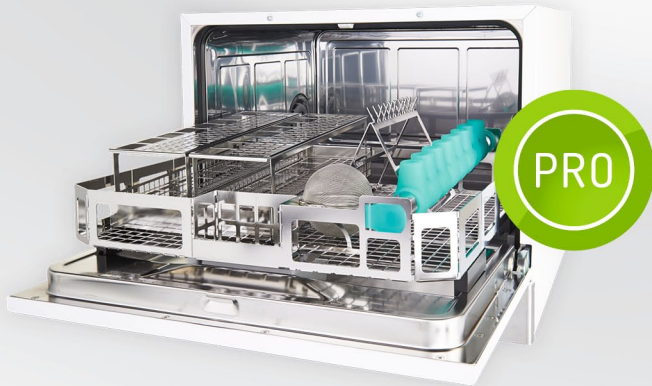
Thermodesinfektor HD 450 PRO