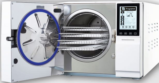
B-Klasse Autoklav TT+ 23